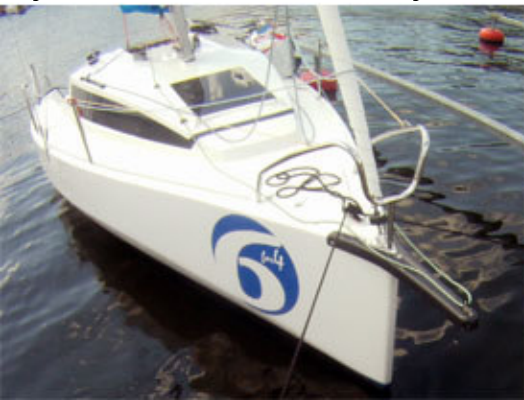
Abgebildete Boote teilweise mit Sonderausstattung

Rumpf und Deck aus PolyesterSandwichmaterial hergestellt im Vakuuminfusionsverfahren für ein optimales Stabilitäts-/Gewichtsverhältnis